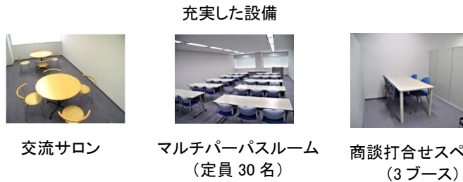
交流サロン マルチパーパスルーム (定員30名) 商談打合せスペース (3ブース)