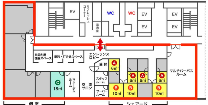
福島駅西口インキュベートルーム平面図

(諸般の事情で募集する部屋の変更がある場合があります。) 詳細はお問い合わせください。