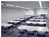
マルチパーパスルーム (定員30名)