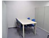
商談打合せスペース (3 ブース)